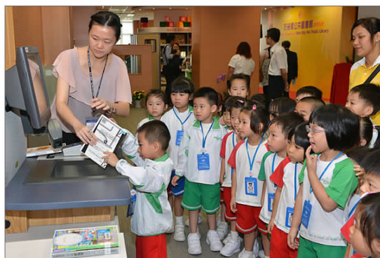
图 6 纸质图书自助借还机

图书馆管理系统升级，实现馆室无需监管、自主运营，便利师生借还流程，提高图书馆纸质资源服务能力。