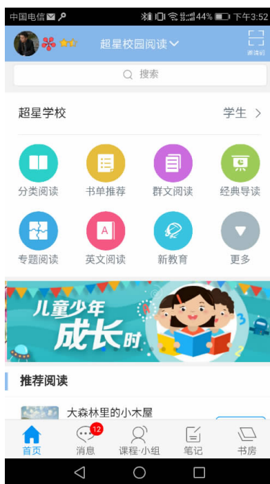
图 5 超星校园阅读系统移动端

手持移动终端专用 APP，与云阅读平台互通互联，并可与学生家长进行账号捆绑，协助学校开展教学共域以及活动的参与、成果的回收。具备日常办公管理功能，实现班级小组、教学小组、兴趣小组等多元办公，并可辅助进行阅读课程教学或常规教学等。