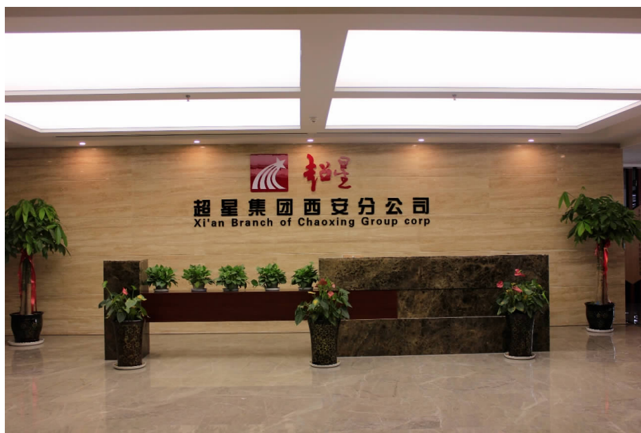
图1 超星集团西安分公司

超星集团西安分公司基础教育事业部，自2013年以来，与中小学的合作发展迅速，目前陕西省合作的中小学多达70所，覆盖西安市、咸阳市、汉中市、安康市、铜川市、渭南市、宝鸡市、榆林市、延安市、商洛市等地区。