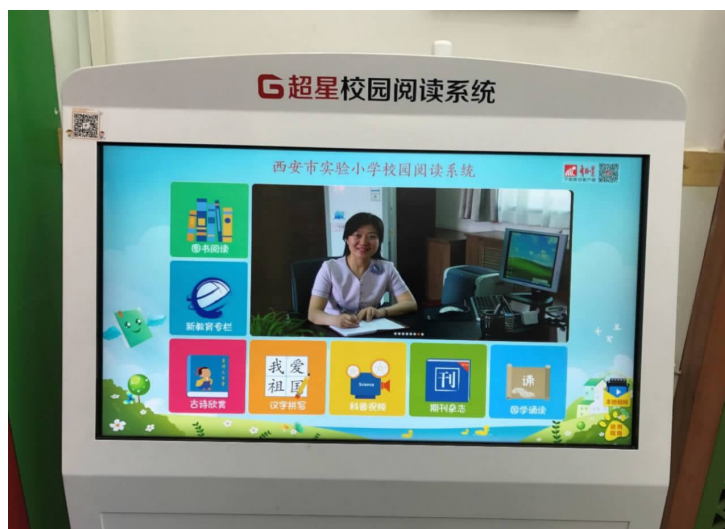
图3 超星校园阅读系统大屏端

图书借阅，点击选中的书，便可以直接翻阅。同时，也可以通过扫描每本书的二维码，下载到移动端进行翻阅。还包含校园视频宣传展示、校园文化展示、新教育专栏、古诗欣赏、国学诵读、科普视频、识字动画、动画绘本等模块。